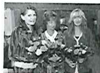
Mehr Mitspracherecht gefordert