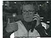
Glückliches Ende nach Verhandlungsmarathon