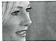
Helene Fischer: Das Ritual muss sein