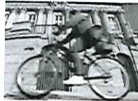
Mit fast zwei Promille auf dem Rad unterwegs