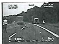
Schwerer Unfall auf der A9 bei Beelitz