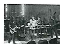
Rausch der Begeisterung

Werderaner Tannenhof öffnet neue Stände in Berlin und weitere Plantage