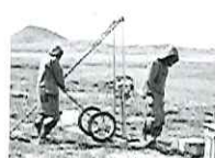
Tickende Zeitbombe unter der Erdoberfläche