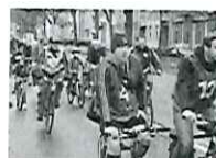
Turnhallen und Sportplätze fehlen